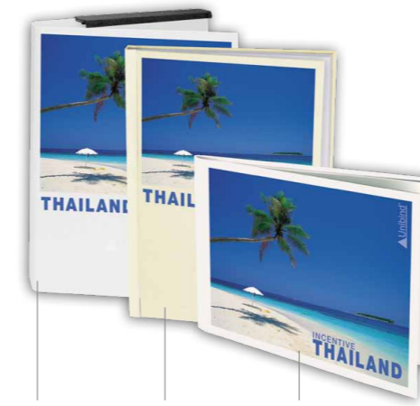
Portfolio SteelBook PhotoBook

Sie können Ihre PortFolios, SteelBooks und PhotoBooks Stück für Stück personalisieren.