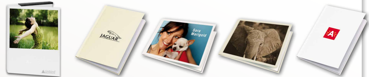
Portfolios Kataloge persönliche Fotobücher Erinnerungsbücher Presse Mappen