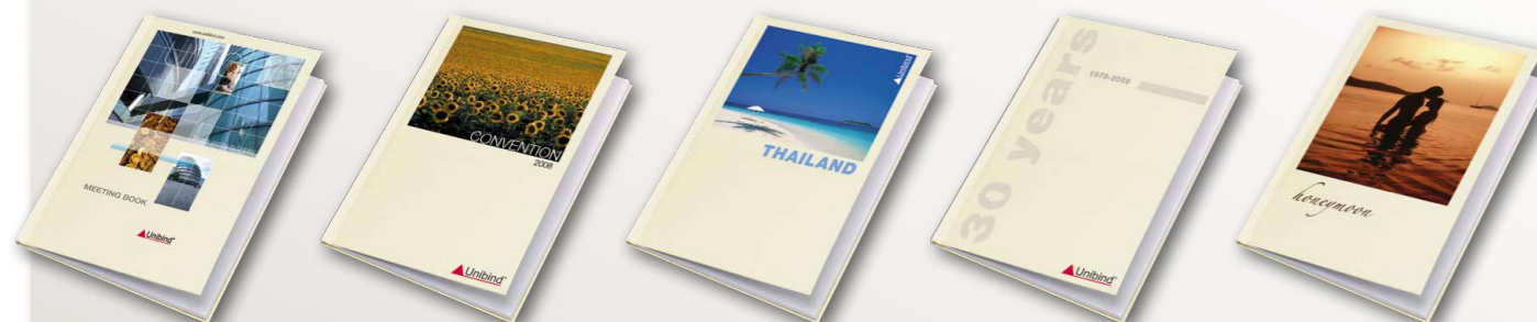
Besprechungen Tagungen Anreize Spezielle Events Ein einzigartiges Geschenk